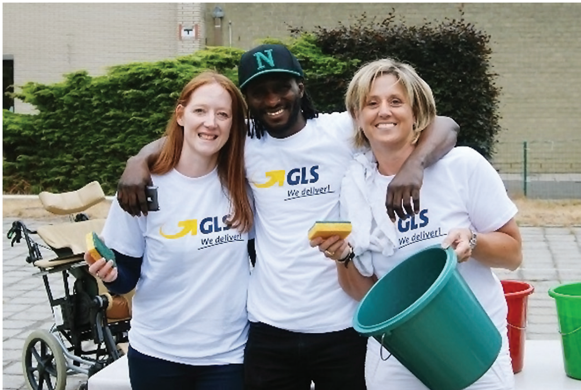
'Volunteering Day' Rolstoel Wash - depot Deinze (september 2017)